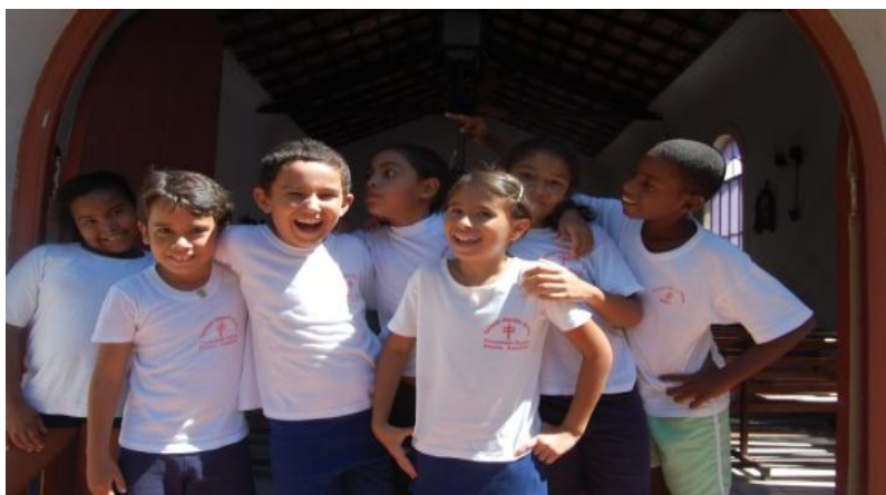
Alunos de Fotografia do Preventório

Moradora da Ilha de Paquetá passou a trabalhar com as crianças e jovens do curso de Fotografia. Certamente sua experiência e contribuição pessoal e profissional faz a Diferença!