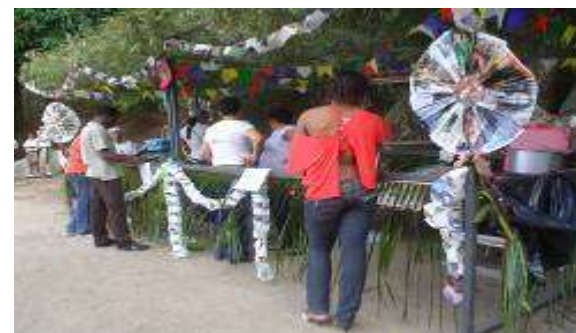
Quiosques com deliciosos quitutes

No sábado, dia 06 de Junho, aconteceu a tradicional Festa Junina do Preventório e quem conhece sabe que além da animada quadrilha a comida nos quiosques é maravilhosa!