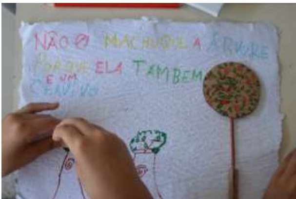
TEM ARTE E POESIA NAS ARVORES PARA OS ALUNOS DA EM JOAQUIM MANOEL DE MACEDO