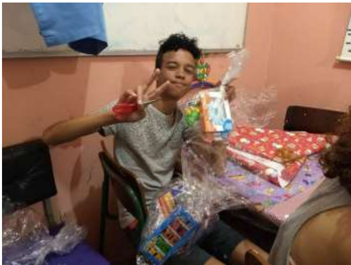
Colônia de Pescadores