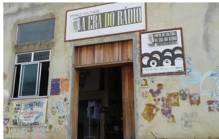
7- Ponto de Cultura RADAR -Rede de Articulação e Dinamização da Arte realizado pela Casa de Cultura Sefaradita na AP5 em Campo Grande. Visitado por Sandra Cotrim.