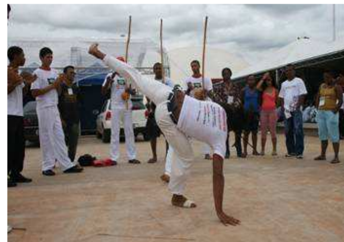
Teia 2008 -Brasilia

Durante o evento tivemos a oportunidade de conhecer todos os Pontos de Cultura e os projetos desenvolvidos.