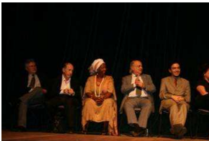
Abertura da TEIA 2008 Brasília