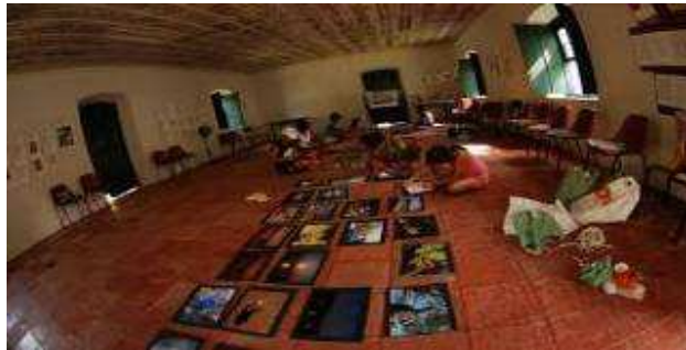
Exposição na Sede do Ponto Biblioteca Popular Municipal de Paquetá

Além de fotografar os alunos participaram da confecção dos novos painéis, colagem das fotos e poesias e montagem conforme imagem abaixo.