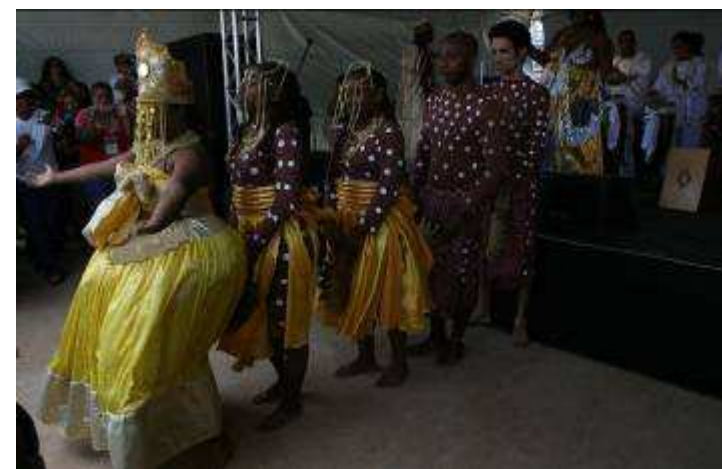
Teia 2008 -Brasilia

Uma das maiores preocupações é transformar o projeto em uma política de governo, o que daria continuidade ao mesmo e a outra é ampliar o número de pontos de cultura atendendo um número maior de instituições que já desenvolvem projetos nestas áreas.