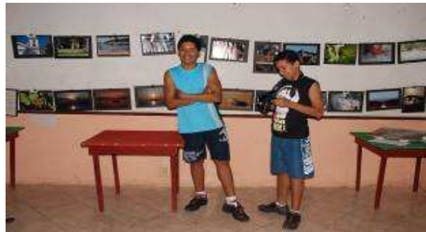
Exposição no Clube Municipal